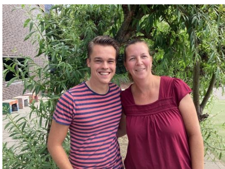
MB5 Salima en Cock