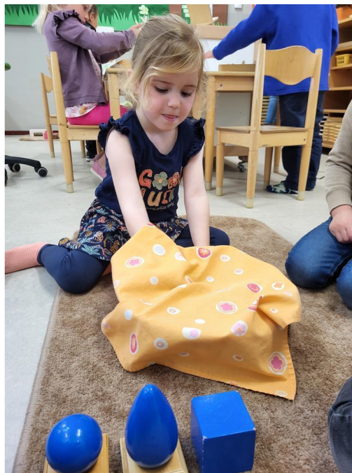
Voelend herkennen van de geometrische lichamen.

Vriendelijke groeten, de leerkrachten van groep 1 en 2