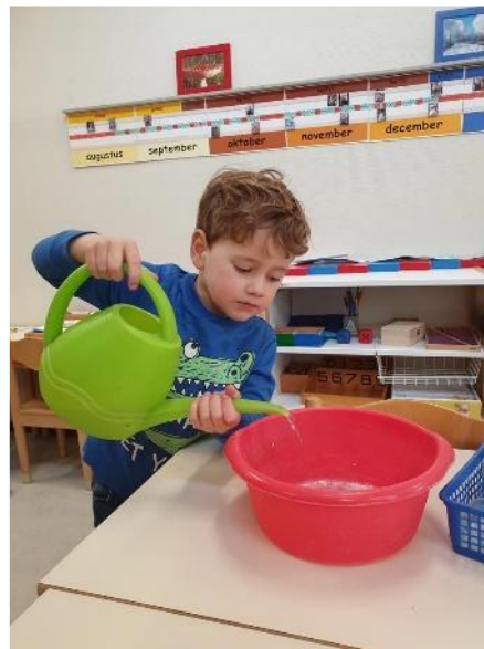
Zelf een sopje maken.

Na het eten zorgen de kinderen dat hun tafels en eventuele bordjes schoon en netjes achterblijven.