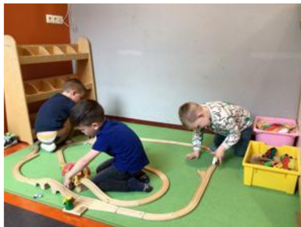
Bouwen in de bouwhoek en spelen met de treinbaan.

Maak voor een langer gesprek a.u.b. een afspraak.