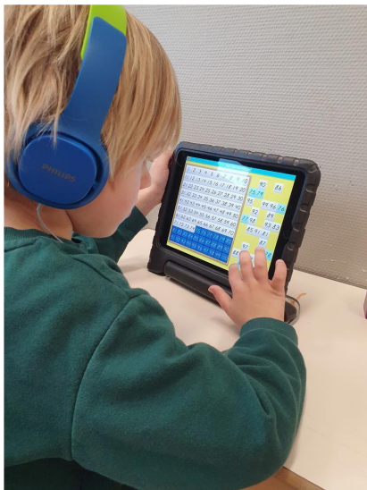
Werken op de Ipad.

Het is verstandig om zoveel mogelijk de naam van uw kind te zetten op de dingen die mee naar school gaan. Denk daarbij aan de gym schoenen, bekers en broodtrommels en ook de jassen. Tijdens het buitenspelen kunnen er soms vier spijkerjackjes uitgetrokken zijn, en welke is dan van uw kind? Mocht u iets kwijt zijn, dan kunt u altijd kijken in de kist met gevonden voorwerpen.