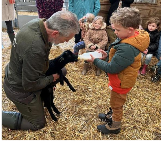
Op bezoek bij de lammetjes.