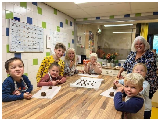
Koken in de keuken.

Schoolgaande kinderen zijn op vierjarige leeftijd nog niet leerplichtig. Op vijfjarige leeftijd is uw kind grotendeels leerplichtig en vanaf zes jaar volledig. Toch is het in verband met het vastleggen van de administratie naar de onderwijsinspectie toe van belang om ook in de onderbouw altijd even vooraf een formulier in te vullen als u uw kind een paar dagen van school wilt houden. Dit formulier kunt u vinden op de website en bij de administratie.