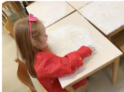
Schrijven in scheerschuim.